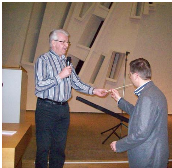
Overhandiging van de baton

Aldus overeengekomen en in drievoud opgemaakt en getekend te 's-Gravenhage.