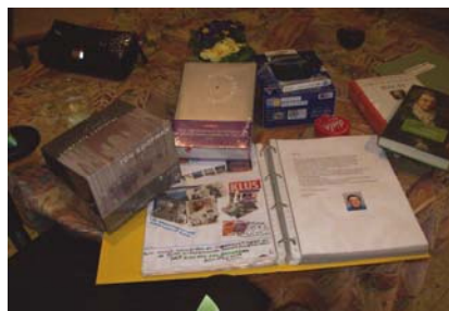
Een tafel vol cadeaus