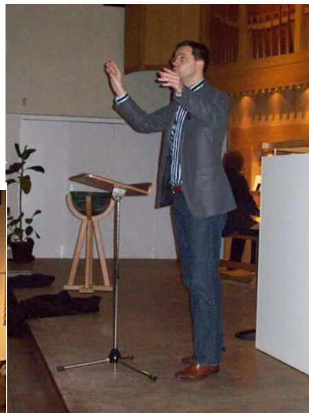
In opperste concentratie op weg naar de toekomst