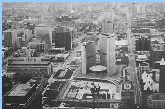
Foto van City Hall in het centrum van Toronto

ningsconcert in Grand Rapids op 21 april werd door meer dan 2500 mensen bezocht. Zeker zeshonderd mensen moesten wegens plaatsgebrek onverrichterzake naar huis terug. Onder hen waren er die zeker zes uur hadden moeten rijden...