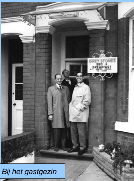
Bij het gastgezin