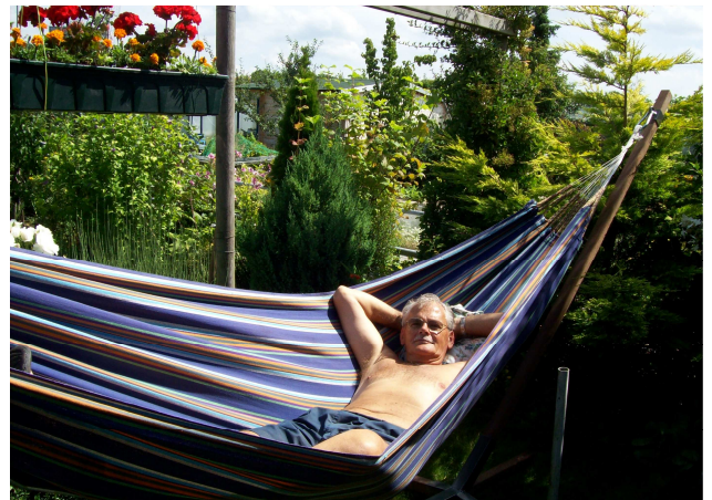
De secretaris gaat het er na de overdracht goed van nemen