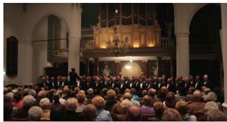
Impressies Benefietconcert Voorburg