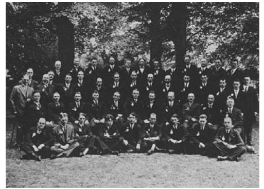
De eerste koorfoto in 1932

In een prachtig verzorgd stencil wordt door 'De Reiscommissie 1932' medegedeeld dat op 11 augustus om 8 uur verzameld wordt op het station Staatsspoor. De trein zal dan vertrekken om 8.10 uur en in Arnhem aankomen 10.51 uur. Per salonboot op naar de Westerbouwing. 's Middags wordt een rondrit per 'autocar' gemaakt rond Arnhem van zo'n drie uur, waarna gedineerd wordt in hotel Geitenkamp . Het eerste lustrum werd zo voor de leden een de dames op grootse wijze gevierd.