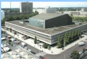
De Doelen te Rotterdam