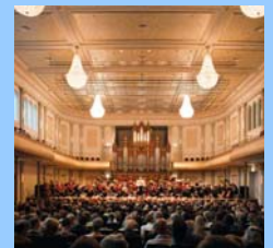
Het Concertgebouw te Haarlem

Voor die platenbaas gingen we tweemaal naar Haarlem om opnamen te maken voor een lp en een EP. U weet toch nog wel wat de afkortingen hiervan waren? De eerste plaat was met Feike Asma en de tweede met Mieke Telkamp: wat een tegenstelling. Het Concertgebouw daar was de plaats van opname.